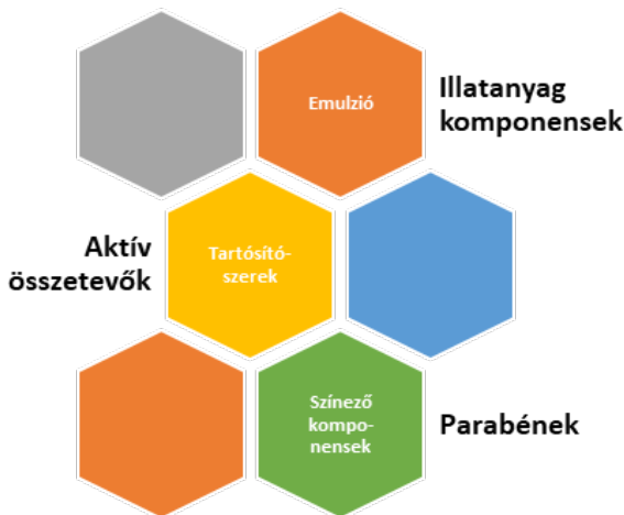
1. ábra. A kozmetikai termékek fő összetevői