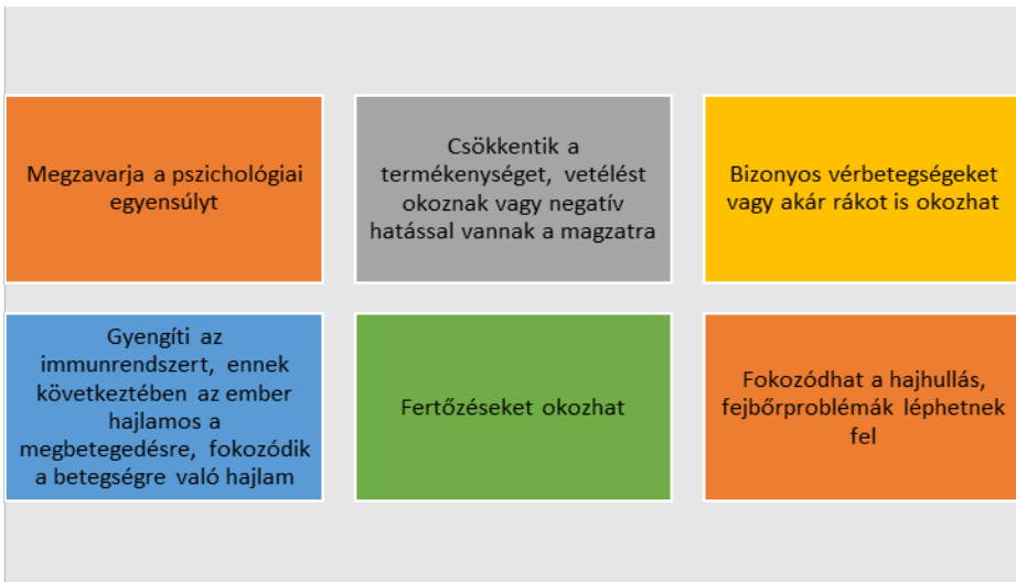
2. ábra. Negatív hatások

Manapság a szépségápolási termékek széles választékát kínálják a fogyasztóknak, és a helyben gyártott és importált szépségápolási termékek fogyasztása évről évre nagy mennyiségben növekszik. Az amerikai piacra például 181 országból importálják a szépségápolási termékeket, sok kozmetikai terméket Kínából hoznak be. Becslések szerint az USA-ban egy nő naponta átlagosan 12 testápolási terméket használ, amelyek 168 különböző összetevőből állnak. A férfiak eközben jellemzően feleannyi kozmetikumot használnak. A legtöbb ilyen terméket közvetlenül a bőrre - a test legnagyobb szervére - viszik fel, és ha közvetlenül felszívódnak, a keringési rendszerbe is bekerülnek. A szépségápolási termékekből származó vegyi anyagok a légutakon, bőrön át felszívódva és belső használaton keresztül is bejutnak a szervezetbe. Többségük biztonságos, de a szépségápolási termékekben már kimutathatók mérgező anyagok is. A szépségápolási termékekben található anyagok és összetevők a következő negatív hatásokat gyakorolhatják az emberi szervezetre: